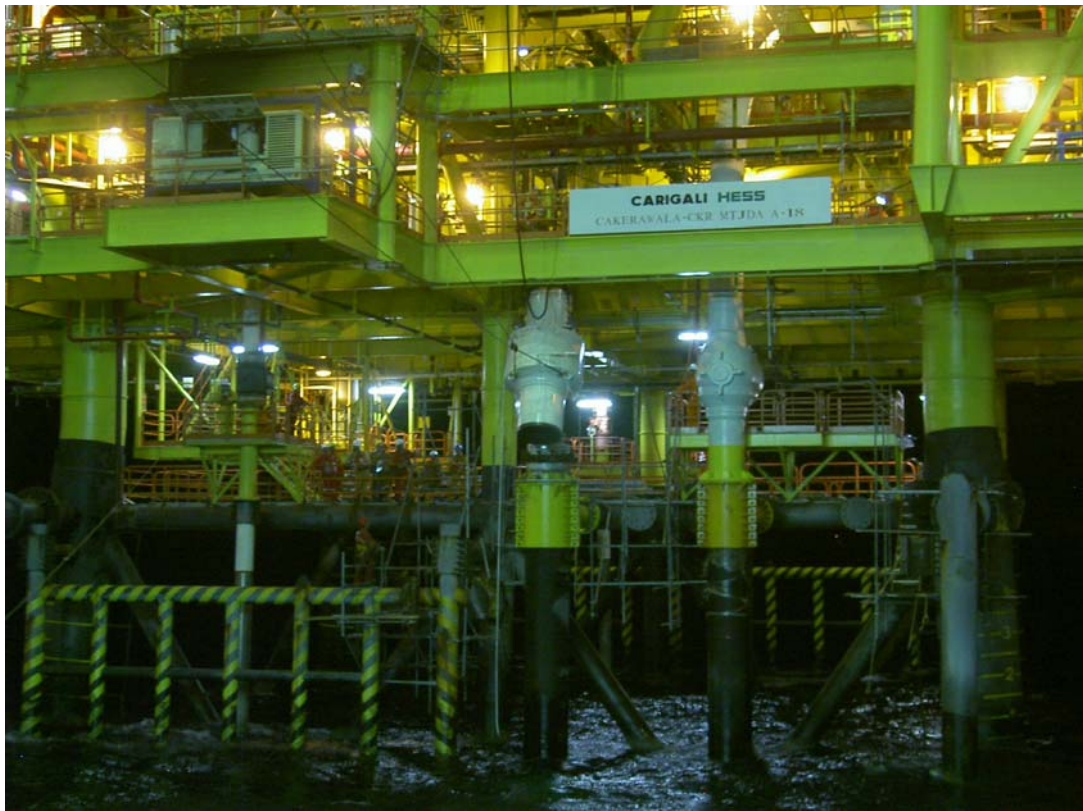
ESDV installation at CKR platform