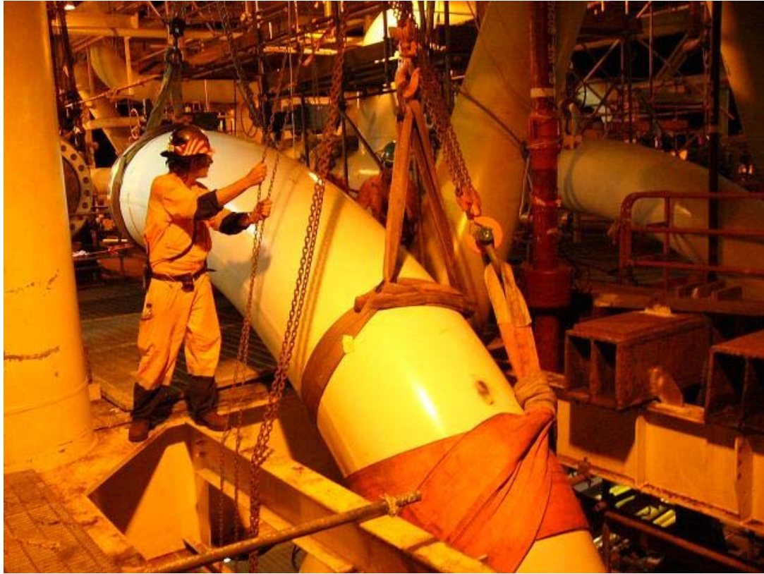
4D bend installation at CKR platform