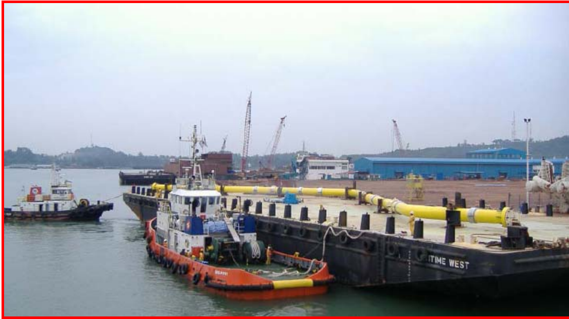
Loading expansion spool onto cargo barge at Batam jetty

จัดวางชิ้นส่วนรองรับการขยายตัวของระบบท่อส่งก๊าซฯ บนเรือบรรทุกที่ทำเทียบเรือ บาตัม