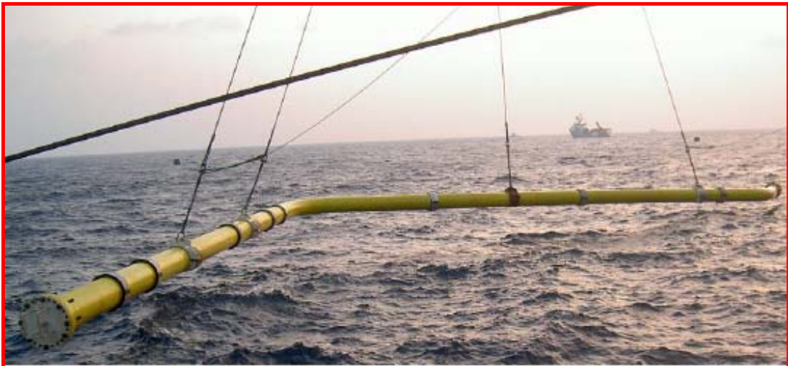
Lowering expansion spool onto the seabed (Wet store)

เรือบรรทุกชิ้นส่วนรองรับการขยายตัวของระบบท่อส่งก๊าซฯ เดินทางถึงที่หน้างาน ในทะเล