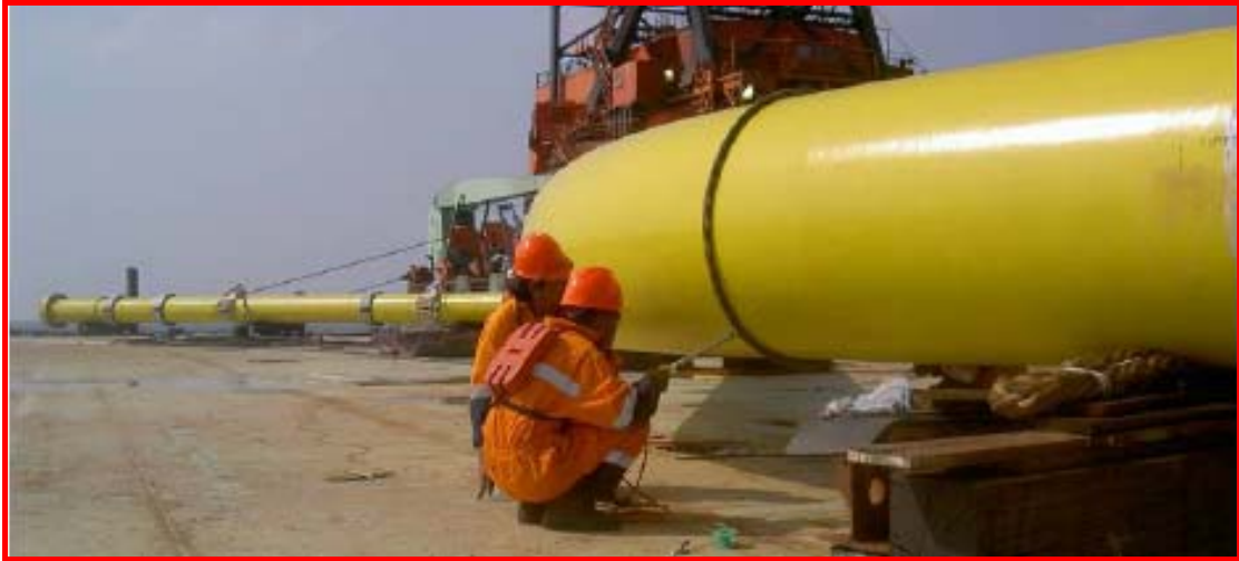
Cargo barge with expansion spool arriving at offshore site

เรือบรรทุกชิ้นส่วนรองรับการขยายตัวของระบบท่อส่งก๊าซฯ เดินทางถึงที่หน้างาน ในทะเล