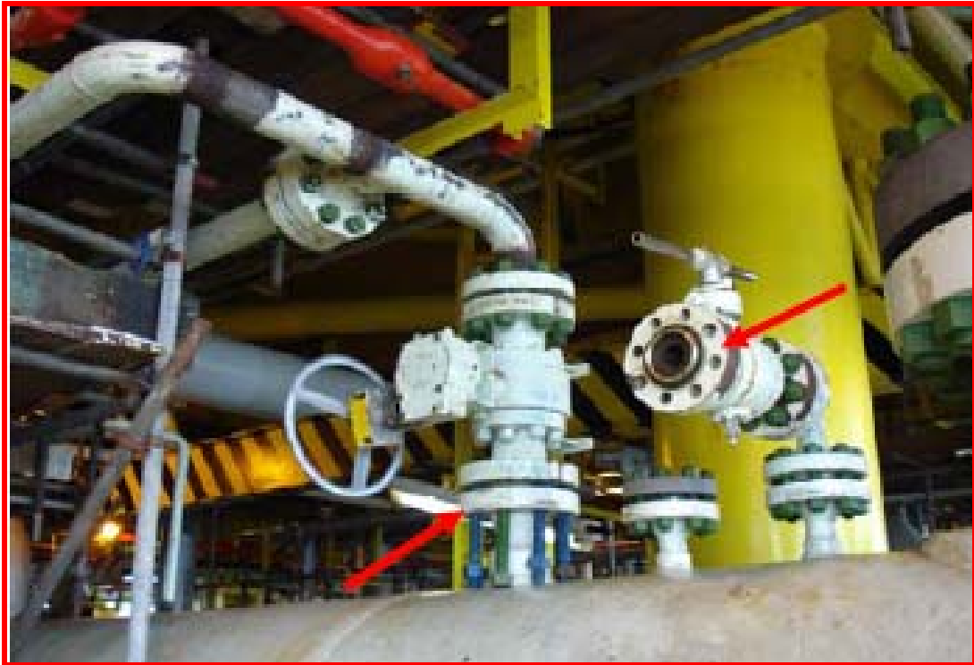
Flooding, cleaning, gauging and caliper survey equipment set up on platform การจัดเตรียมความพร้อมของอุปกรณ์สำหรับการทำความสะอาดและทดสอบระบบท่อส่งก๊าซฯ แล้ว