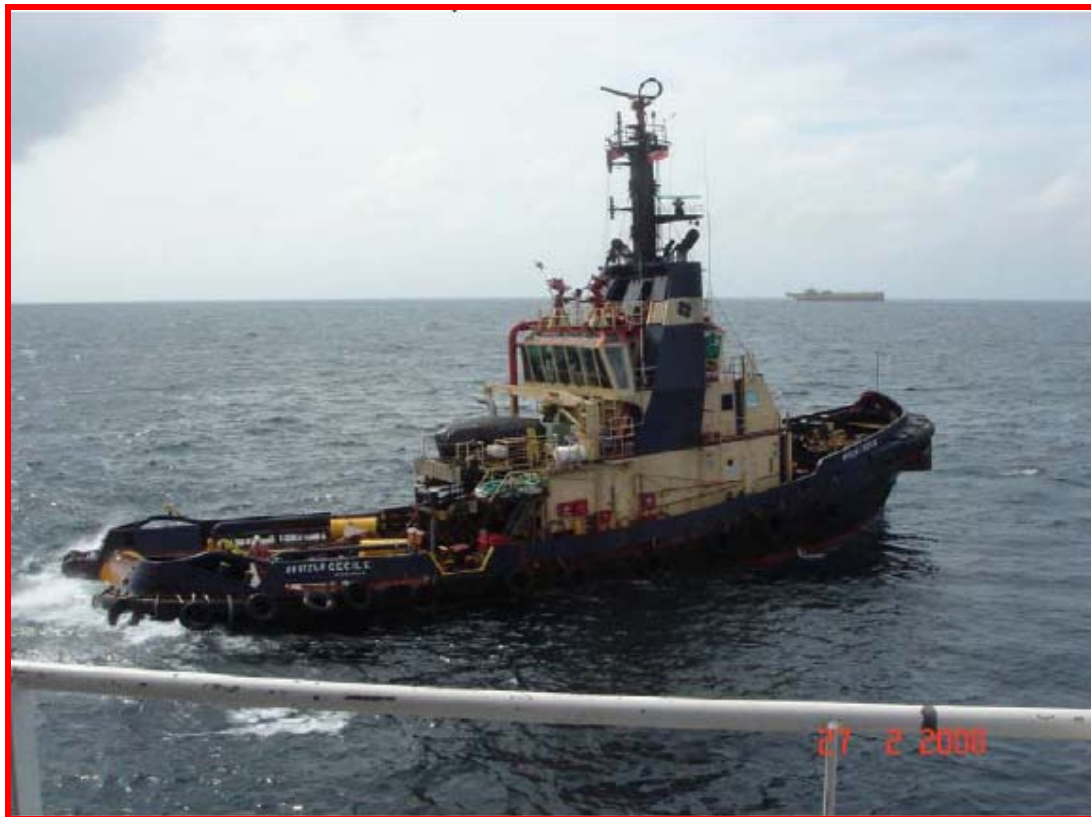
Anchor handling tug boats arrived in the field เรือจัดการสมอได้เดินทางมาถึงหน้างานเรียบร้อยแล้ว