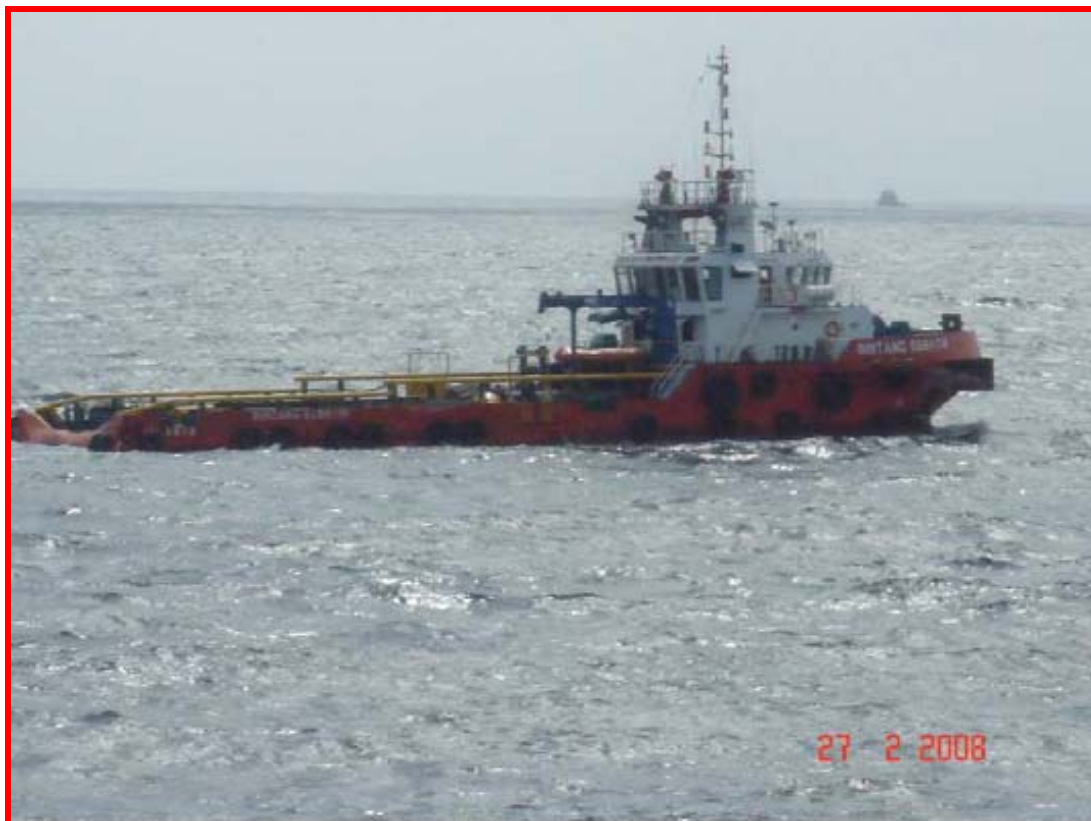
Anchor handling tug boats arrived in the field เรือจัดการสมอได้เดินทางมาถึงหน้างานเรียบร้อยแล้ว