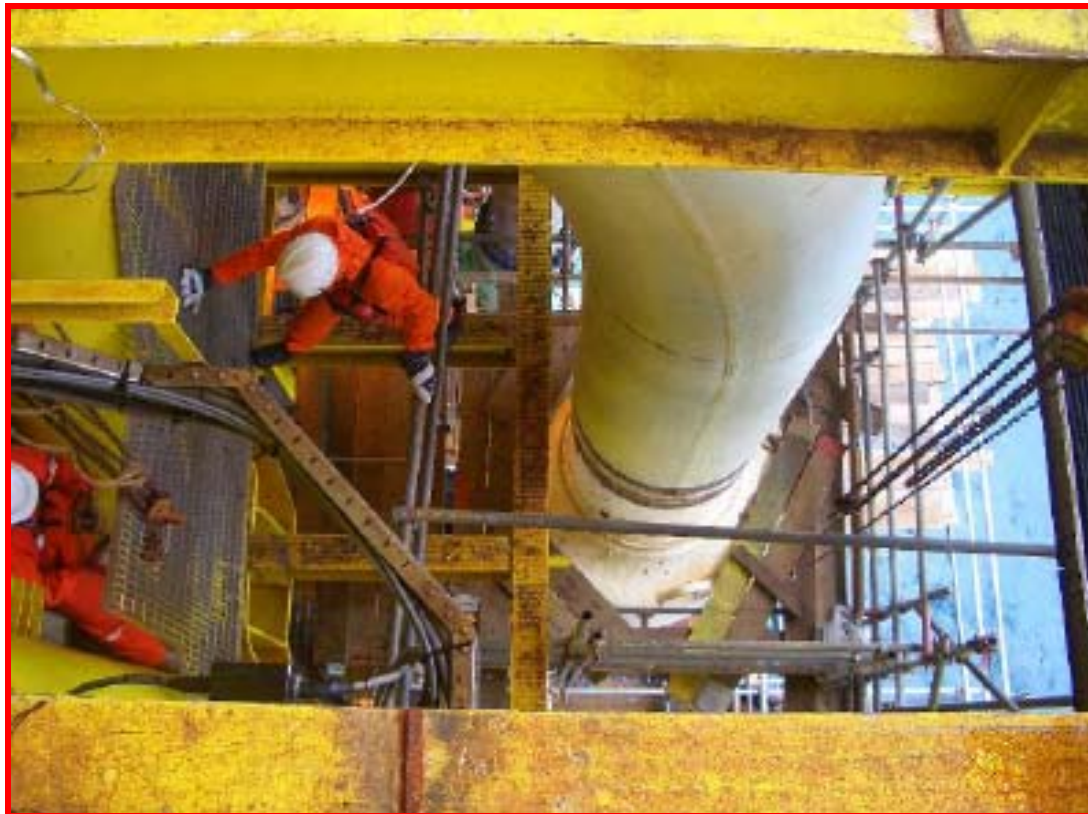
ESDV actuator installation started on CKR platform

เรือสนับสนุนการทำความสะดวกและทดสอบระบบท่อส่งก๊าซฯ ได้เดินทางมาถึงหน้างานเรียบร้อยแล้ว