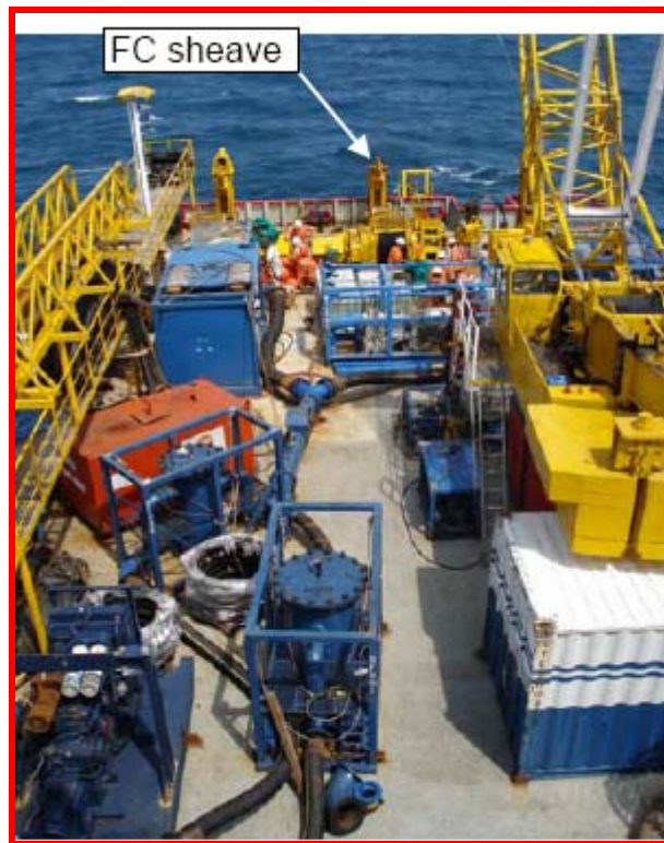
Equipment on deck of pre-commissioning supporting vessel (Trinity Elbe) เครื่องมือและอุปกรณ์บนเรือสนับสนุนการทำความสะดวกและทดสอบระบบท่อส่งก๊าซ