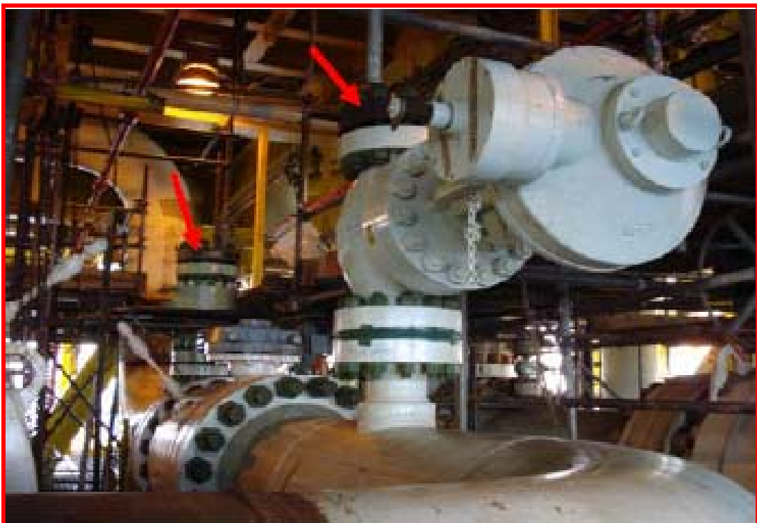
Flooding, cleaning, gauging and caliper survey equipment set up on platform การจัดเตรียมความพร้อมของอุปกรณ์สำหรับการทำความสะอาดและทดสอบระบบท่อส่งก๊าซฯ แล้ว