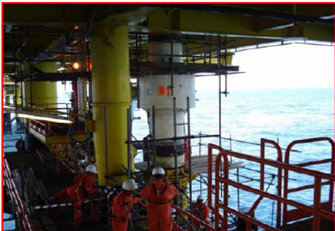
ESDV actuator installation started on CKR platform เริ่มการติดตั้งอุปกรณ์ปิด เปิดวาล์วฉุกเฉินบนแท่นในทะเลแล้ว