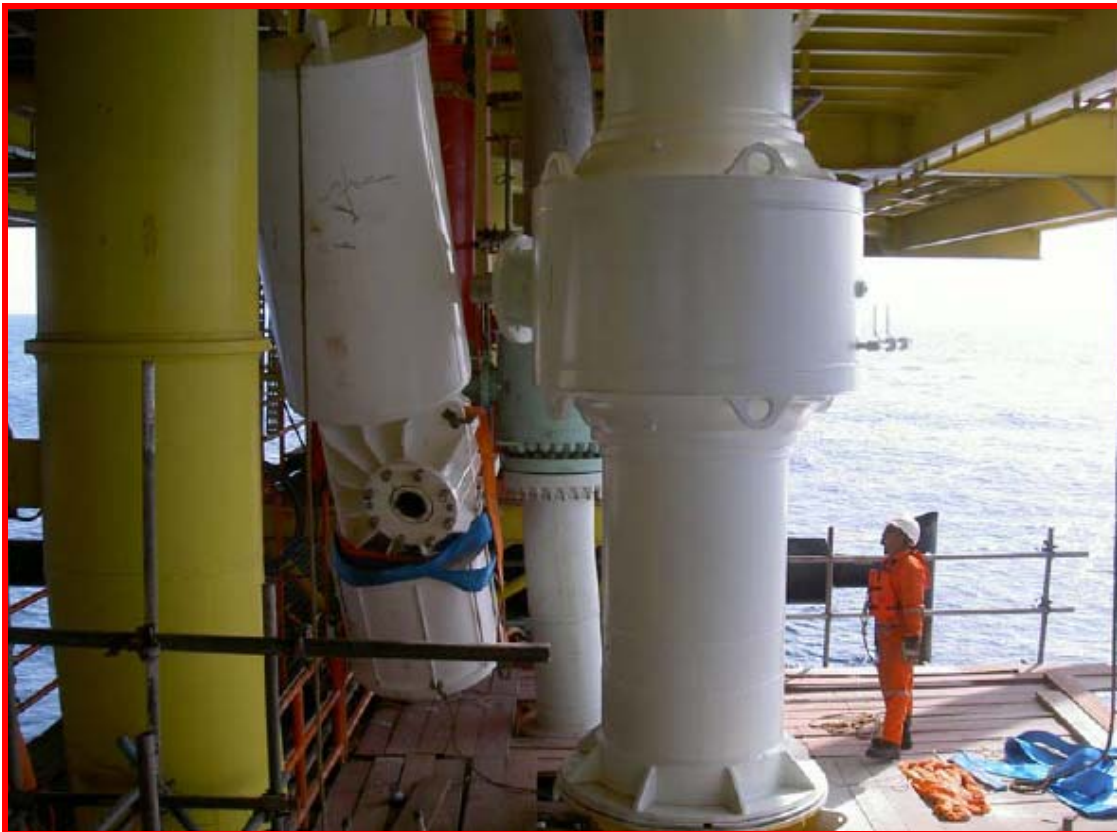
ESDV actuator installation

ติดตั้งอุปกรณ์ปิด เปิดวาล์วฉุกเฉินบนแท่น