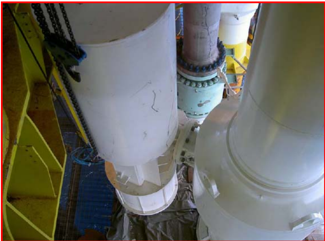
ESDV actuator installation

ติดตั้งอุปกรณ์เปิด ปิดวาล์วฉุกเฉินบนแท่น