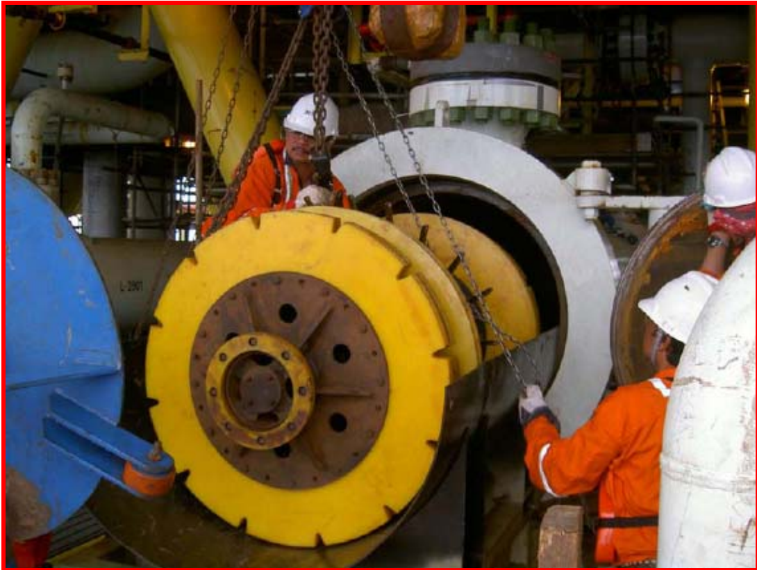
Insert caliper pig for pipeline survey ติดตั้งกระสวยเพื่อสำรวจภายในระบบท่อส่งก๊าซฯ