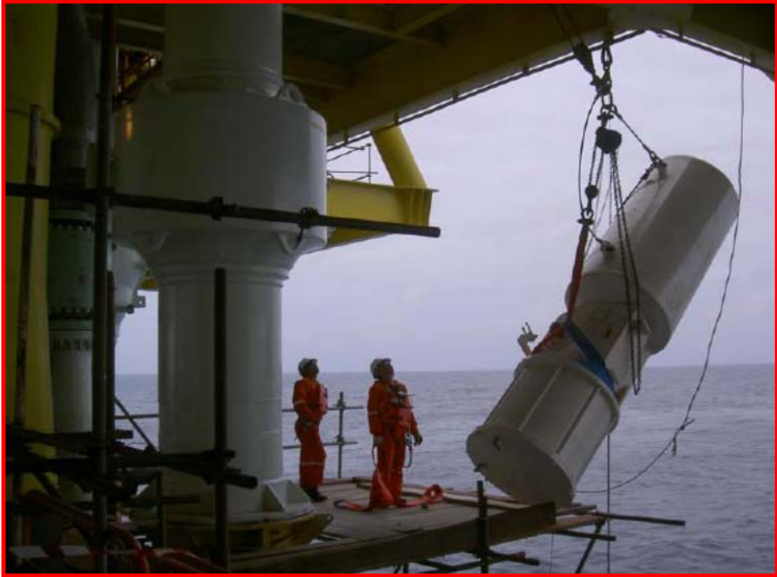
ESDV actuator installation

ติดตั้งอุปกรณ์ปิด เปิดวาล์วฉุกเฉินบนแท่น