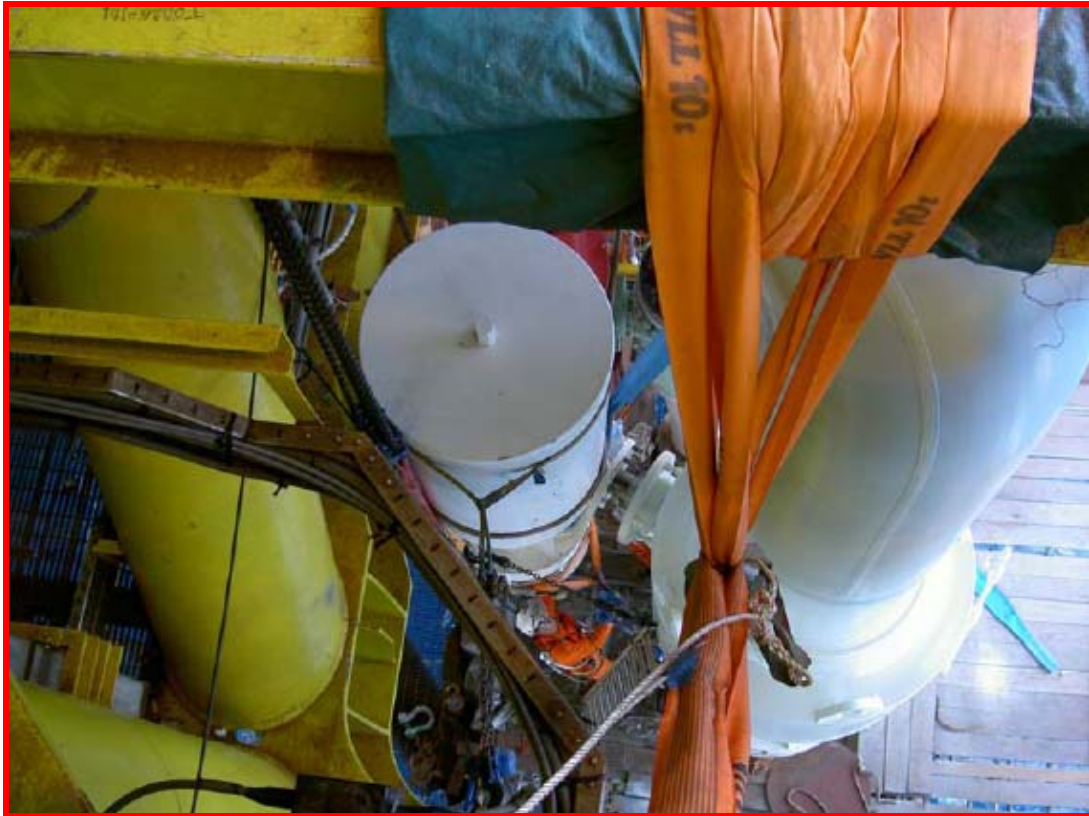
ESDV actuator installation

ติดตั้งอุปกรณ์เปิด ปิดวาล์วฉุกเฉินบนแท่น