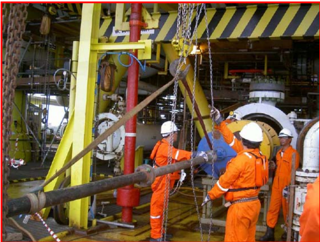
Insert caliper pig for pipeline survey ติดตั้งกระสวยเพื่อสำรวจภายในระบบท่อส่งก๊าซฯ